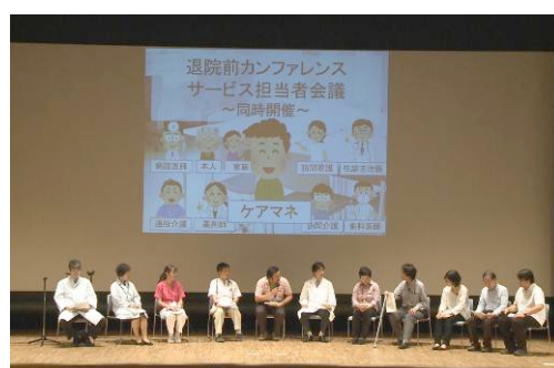
劇形式によるロールプレイングの様子

高齢者が住み慣れた地域で自分らしい暮らしを続けることができるよう、在宅医療・介護連携を軸とした地域包括ケアシステム〈あおばモデル〉の取組みを「次世代郊外まちづくり」のリーディング・プロジェクトの一つとして進めています。本フォーラムでは、〈あおばモデル〉について事例を元にロールプレイングで分かりやすく解説します。