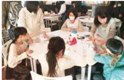
身近な素材で作るおもちゃ作りのワークショップ