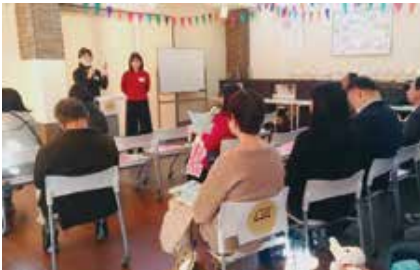
地域で保育・子育てを支える活動実践者によるミニレクチャー