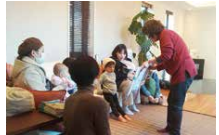
モデル棟を使った絵本の読み聞かせ