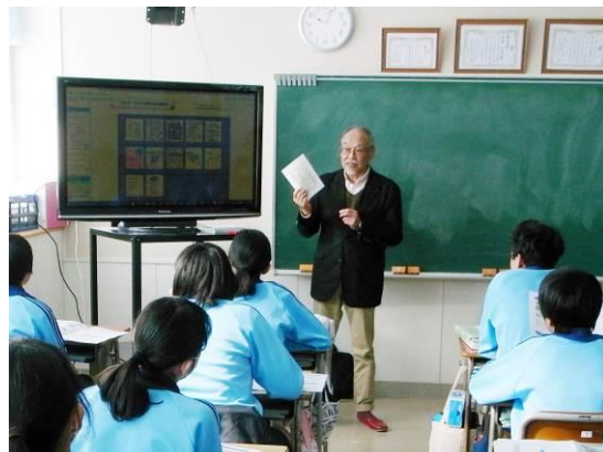
④地域にお住まいの方にご協力いただいた 「e-Book」作成授業の様子(平成28年2月)