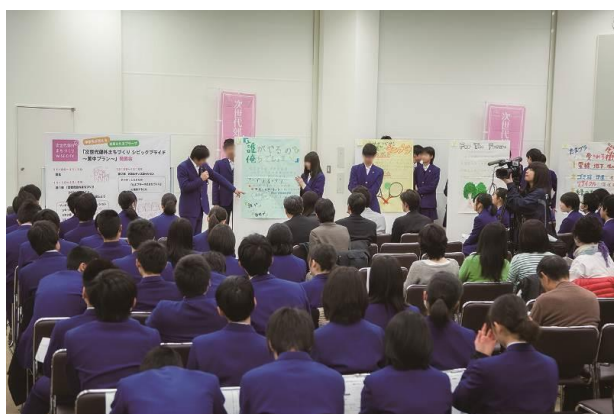
①前回発表会の様子 (平成26年3月)