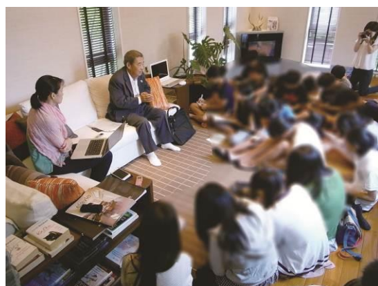
②AOBA+ARTと連携した「街のはなし」 インタビューの様子(平成27年7月)