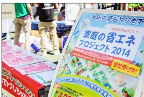
延べ2,725世帯にご参加いただいた 「家庭の省エネプロジェクト」

平成25年度から実施している「家庭の省エネプロジェクト」では、地域にお住まいの多くの方々にご参加いただき、これまで累計約122t（杉の木換算8,700本分）ものCO2を削減し、大きな効果を上げました。また、家庭のエコ診断では、40回の診断会を実施し、累計440世帯のご家族のエネルギー使用状況を診断しました。