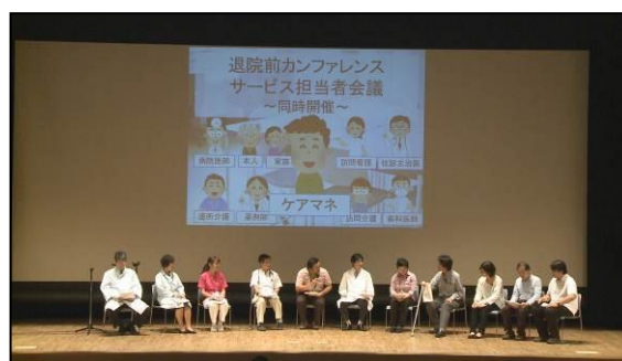
連携強化セミナーの様子

医療・介護の専門職が一堂に会した「連携強化セミナー」や「多職種連携ワークショップ」を開催し、また、「あおばモデル」を地域の皆さまに広く知っていただくための講演会も開催しました。