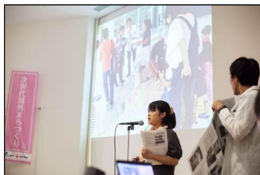
約1年間の取組成果を各企画が報告会で発表