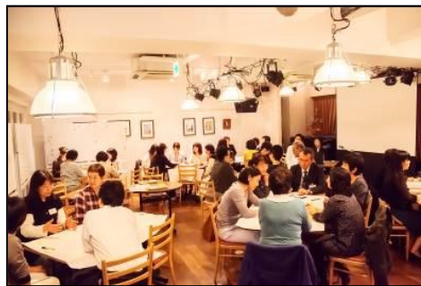
子ども・子育てタウンミーティングの様子

モデル地区において、保育・教育・子育て支援などに携わる多様な主体が参画した「子ども・子育てタウンミーティング」を3回開催しました。より子育てしやすいまちづくりの実現を目指し、保育・子育てに関わる様々な主体が連携・協働していくための仕組みづくりを検討しました。