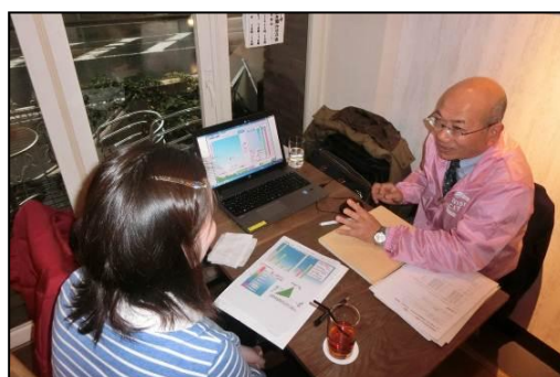
「家庭のエコ診断」の様子