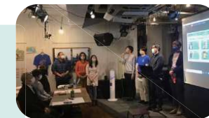
最終報告会の様子