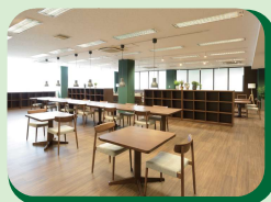
▲コミュニティラウンジ内観