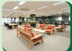
▲ワークラウンジ内観