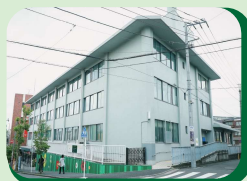
▲青葉台郵便局外観